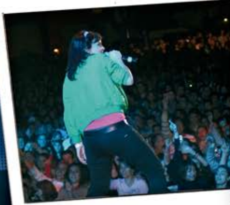
Fin de Gira (Leganés)