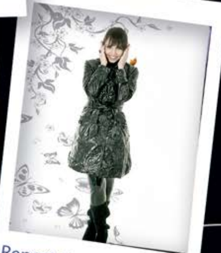
Reportaje Costa Rica